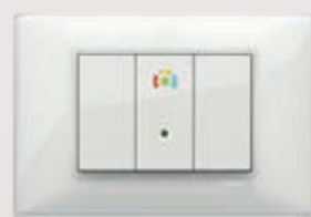
Sistema antintrusione By-alarm