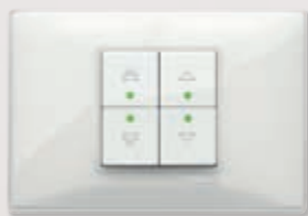
Automazione per gli edifici Well-contact Plus