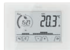
Termostato touch Wi-Fi

Dal 1 al 30 Novembre 2019. Solo presso i grossisti che partecipano alla promozione e fino ad esaurimento scorte.