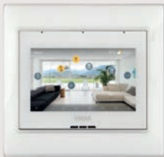
Sistema domotico By-me Plus