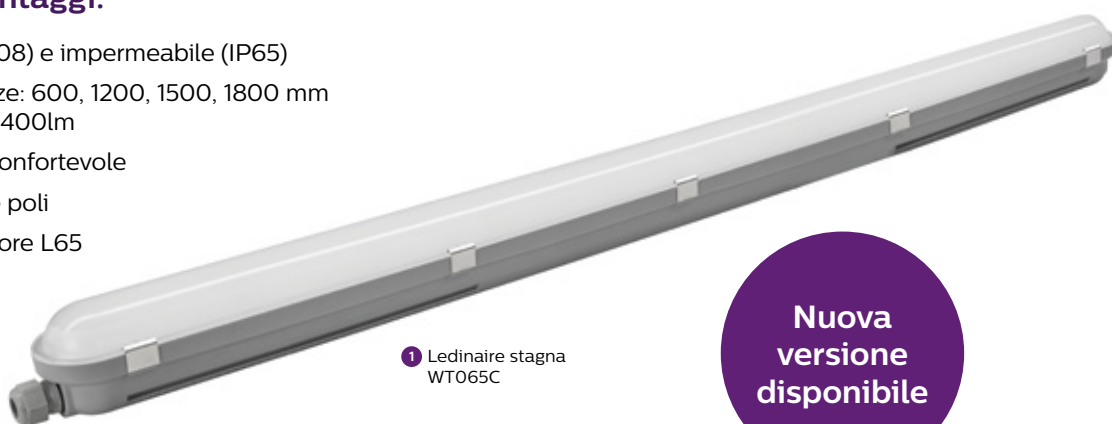
1 Ledinaire stagna WT065C