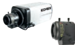
Telecamere Box IP e obiettivi