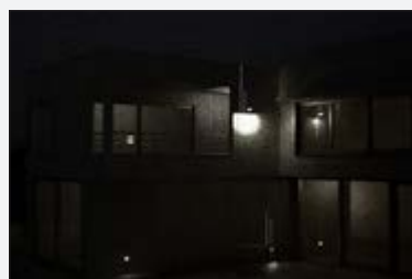
Ripresa da telecamera standard