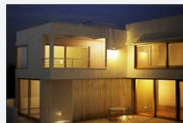
Ripresa da telecamera Low Light