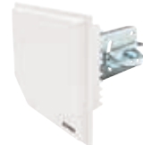
Antenne per ponti radio