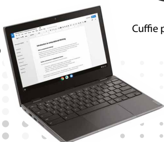
Notebook - LENOVO