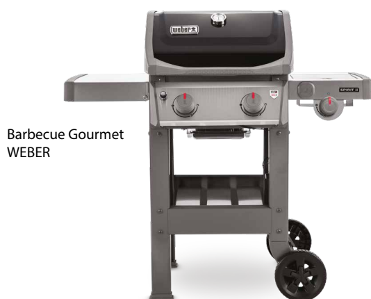
Barbecue Gourmet WEBER