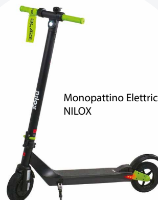
Monopattino Elettrico NILOX