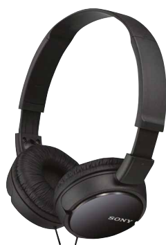
Cuffie pieghevole SONY