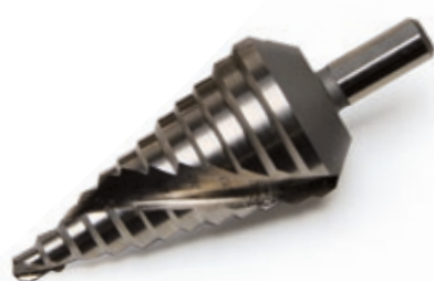
SC-PG1 Fresa conica misura PG