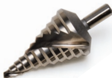
SC-M1 Fresa conica misura Metrica

• Materiale: Nitrato di boro cubico (CBN)