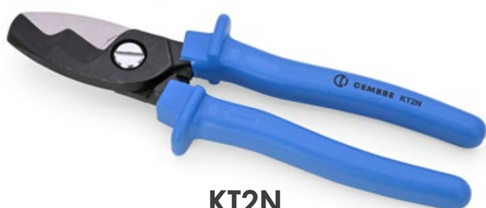
KT2N Utensile tranciacavi per cavi in Al e Cu Ø max 20mm