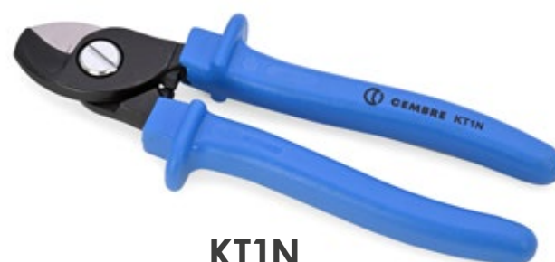
KT1N Utensile tranciacavi per cavi in Al e Cu Ø max 15mm