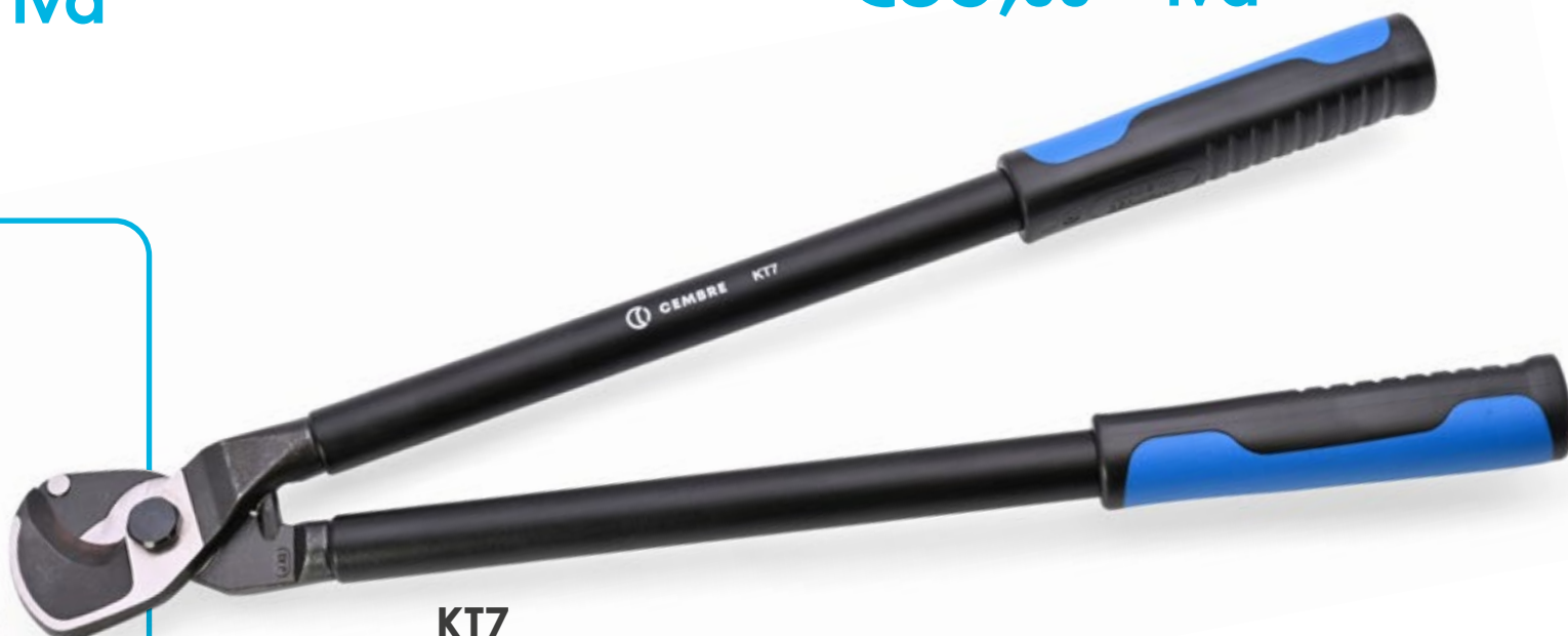
KT7 Utensile tranciacavi per cavi in Al e Cu Ø max 27mm