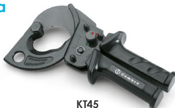
KT45 Utensile tranciacavi a cricchetto per cavi in Al e Cu Ø max 45mm

• Materiale: Nitrato di boro cubico (CBN)