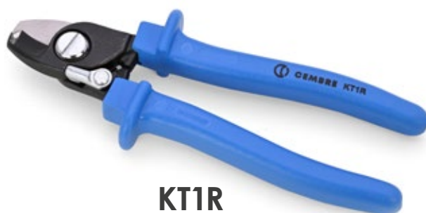
KT1R Utensile tranciacavi per cavi in Al e Cu Ø max 12mm